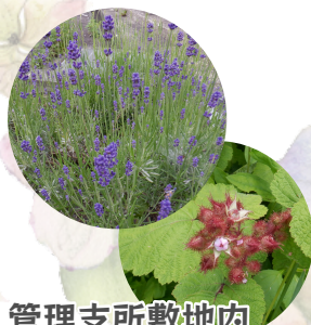
管理支所敷地内のラベンダーと ホイチゴ