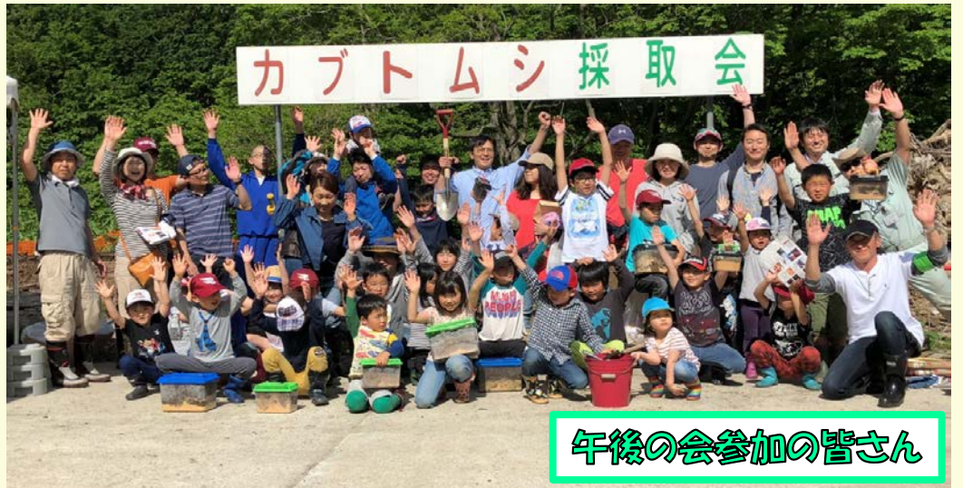
午後の会参加の皆さん