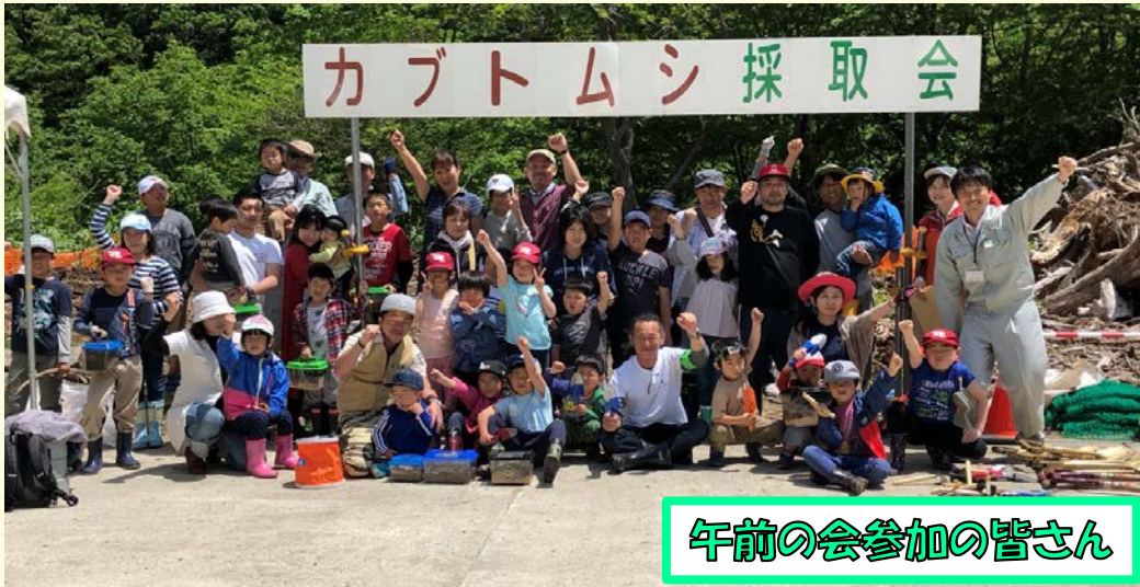
午前の会参加の皆さん