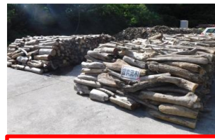
流木集積場の状況