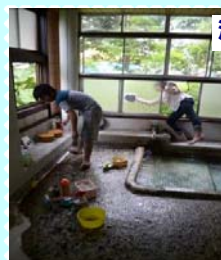
浴槽清掃も行いました