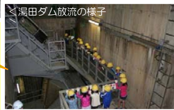
<湯田ダム放流の様子>