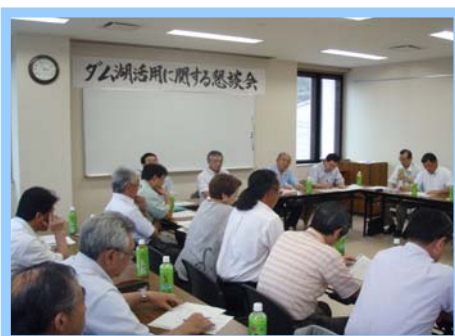
ダム湖活用に関する懇談会