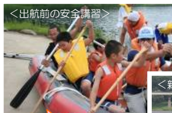
<出航前の安全講習>