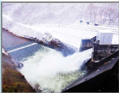
雪景色の放流風景

12月1日に田瀬ダムでは今年度2回目となる、水位維持のための放流が行われました。ダム放流は6日間続き、放流期間中に雪が降ったり快晴だったり、天候によって変わるさまざまな表情を見ることが出来ました。