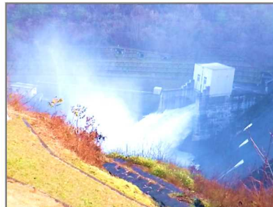
水しぶきと放流風景