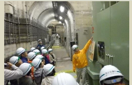
花巻市市民講座様