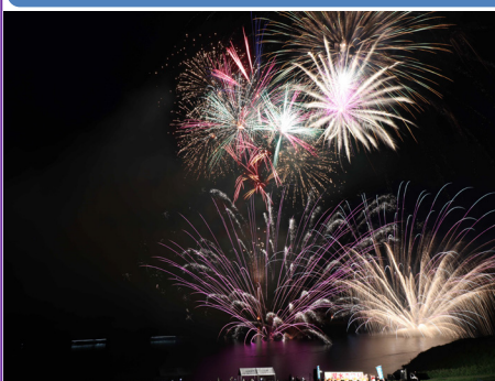
水・空中花火大会