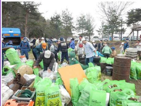
田瀬湖一斉清掃&ごみ川柳大会