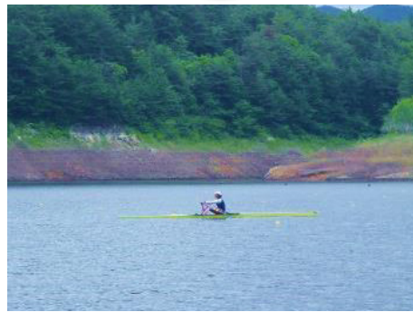
ボート日本代表強化合宿