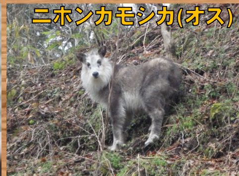
ニホンカモシカ(オス)