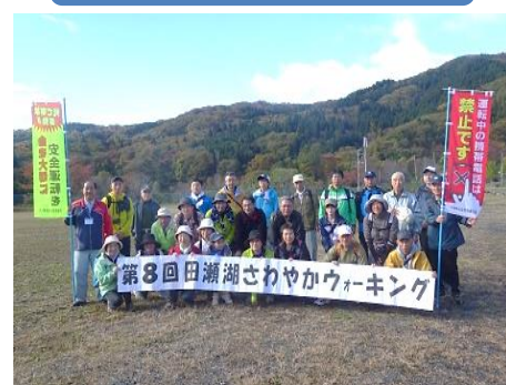
田瀬湖さわやかウォーキング