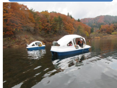
田瀬湖ワカサギ釣り