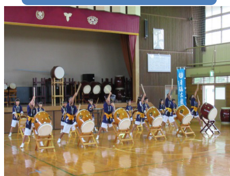
田瀬みのりまつり