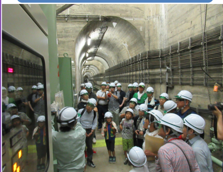
田瀬ダム森林探検隊