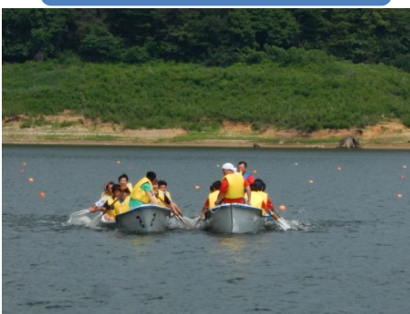
Eボートレース大会