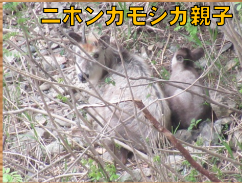
ニホンカモシカ親子