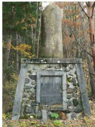
〔野金山部落入口道路脇〕