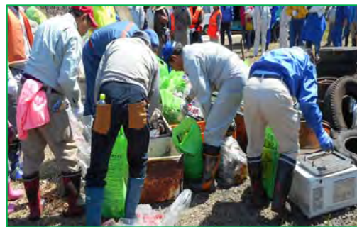
昨 年 の 様 子