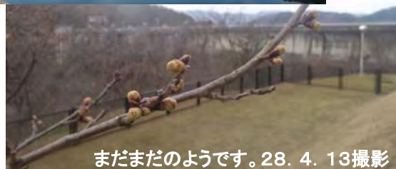
まだまだのようです。28. 4. 13撮影