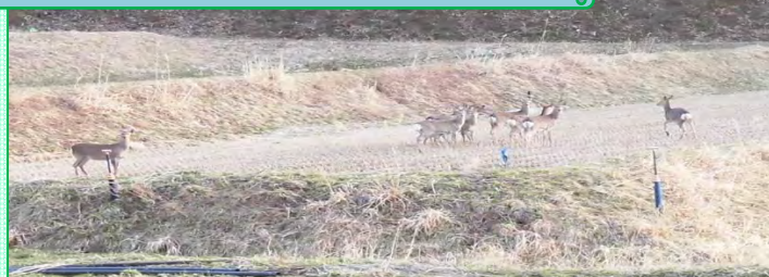
近くの畑で鹿の群れがみられました。 28. 4. 6 撮影