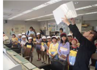
稲瀬小4年生の皆さん