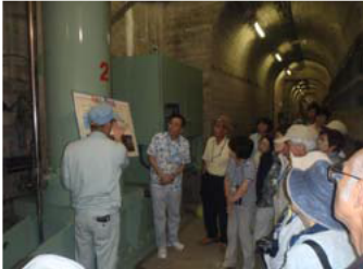
市民講座の皆さん

8月はダム見学に市民講座・奥州市稲瀬地区振興会・奥州市立稲瀬小4年生と多くの方々に来ていただきました。ありがとうございます。予約が必要ですが、皆さんも是非来て下さい。