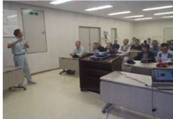
稲瀬地区振興会の皆さん