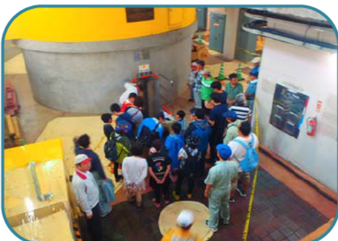
東和電力所の様子