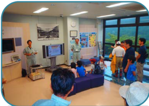
ものしり館の様子

参加してくれた小学生が「寒かったけど、楽しかったよ。大きくなったらダムの仕事がしたいです。」と、お話ししてくれました。