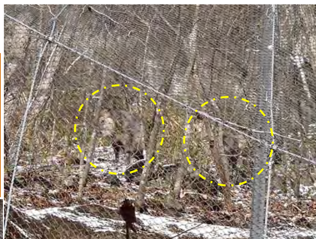
写真撮影:H27. 1. 8 (12時半頃)

翌日の午前中にも、職員が旧車庫へ向かう途中で、草のゴソゴソする音がするとふと見上げると、2mほどしか離れていないところにカモシカが堂々と立っていたのだそうです。突然の野生動物に驚き、怖いくらいだったそうです。