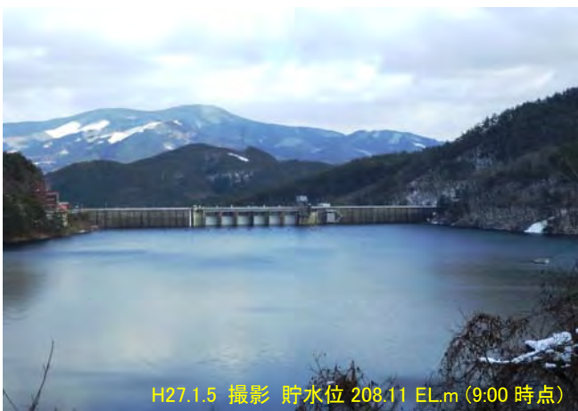
H27.1.5 撮影 貯水位 208.11 EL.m (9:00 時点)