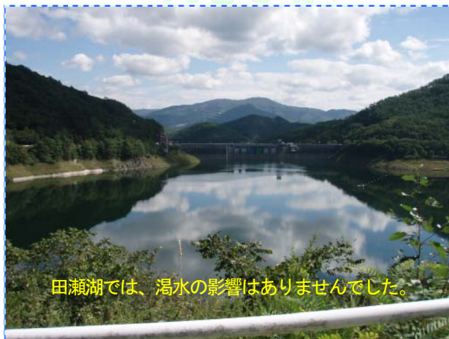
田瀬湖では、濁水の影響はありませんでした。