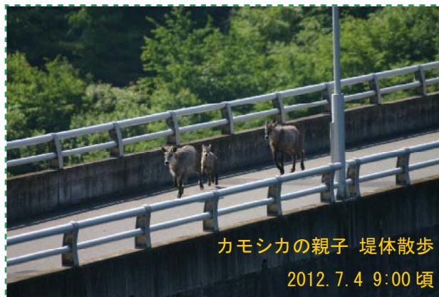
カモシカの親子 堤体散歩