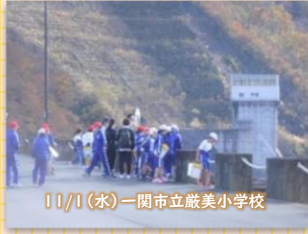
11/1(水) 一関市立厳美小学校