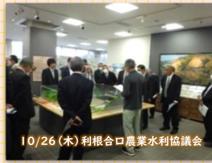
10/26(木) 利根合口農業水利協議会