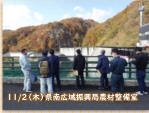
11/2(木) 県南広域振興局農村整備室