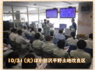
10/31(火) ほかに胆沢平野土地改良区