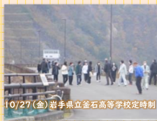
10/27(金) 岩手県立釜石高等学校定時制