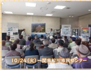
10/24(火) 一関市松川市民センター