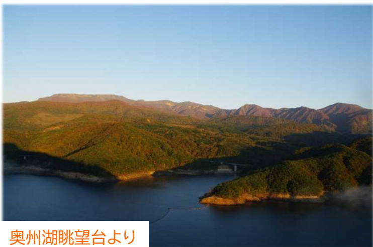
奥州湖眺望台より

★ダム天端は一般開放中(日中のみ)★ * * * * * -湖面から紅葉を満喫! 水上散歩のご案内-