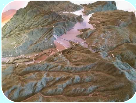
胆沢扇状地が一目でわかる模型や、胆沢ダムと周辺の山々を現した模型がズラリ！

胆沢ダムの麓に位置し、カヌーやラフティングなどのアクティビティ拠点として賑わう奥州湖交流館。ここでは、郷土の歴史や水に関わる文化をパネルや模型を使って紹介しています。精巧で迫力ある模型は必見！