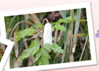
春を告げる小さな花々