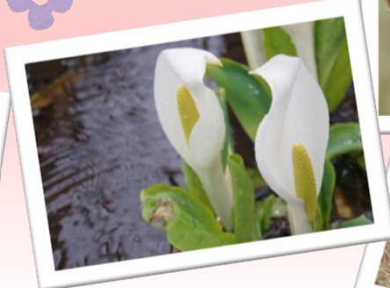
馬留湿地には水芭蕉が咲きます （昨年の様子・4月上旬頃）