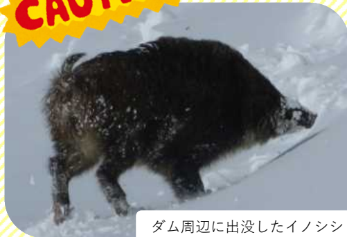
ダム周辺に出没したイノシシ

以前より、胆沢ダム周辺でイノシシの目撃情報があります。イノシシに噛まれたり突進されたりすると大変危険です。追い払おうと物を投げたり、エサを与えたりしないようにしましょう。見つけても刺激せず、近寄らず、静かに立ち去りましょう。