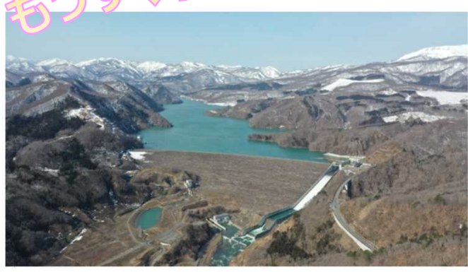
越流：白雪の滝（昨年の様子・昨年は3月10日開始）