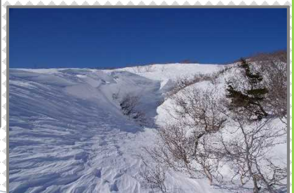
風の勢を感じる雪庇（せっぴ）