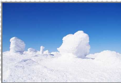
山頂の強風がつくるアイスモンスター