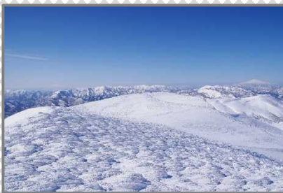
連なる海老の尻尾と雪化粧の百名山