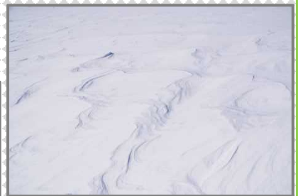
雪上に描かれた風紋（シュカブラ）