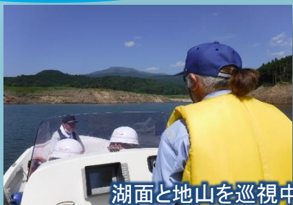
湖面と地山を巡視中