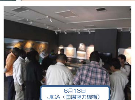
6月13日 JICA(国際協力機構)

見学は随時受付中です。 問い合わせ先: 胆沢ダム管理支所 電話: 0197-49-2981 平日 9時~17時まで