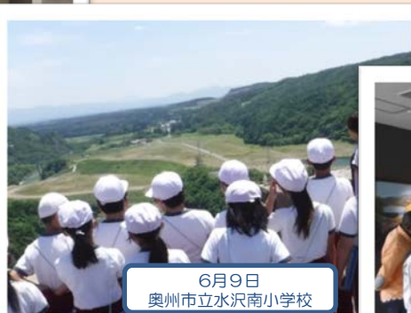
6月9日 奥州市立水沢南小学校