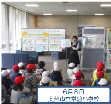
6月8日 奥州市立常盤小学校