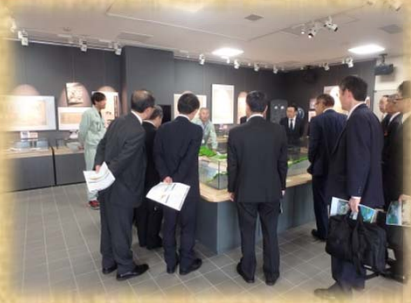
4/24 東北地区信用金庫理事会様