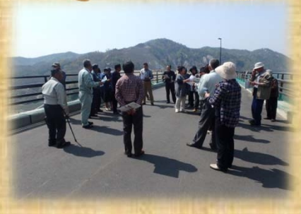
4/28 姉体中央いきいきサロン 様