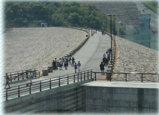
ダム天端を見学する様子