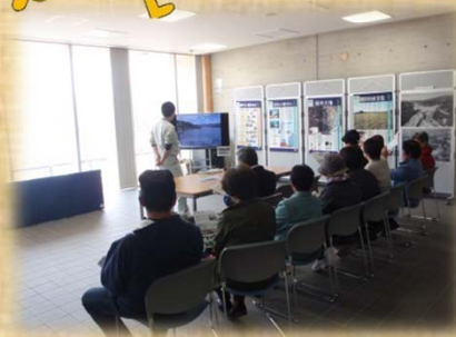
4/22 一関ゆうゆうサロン 様