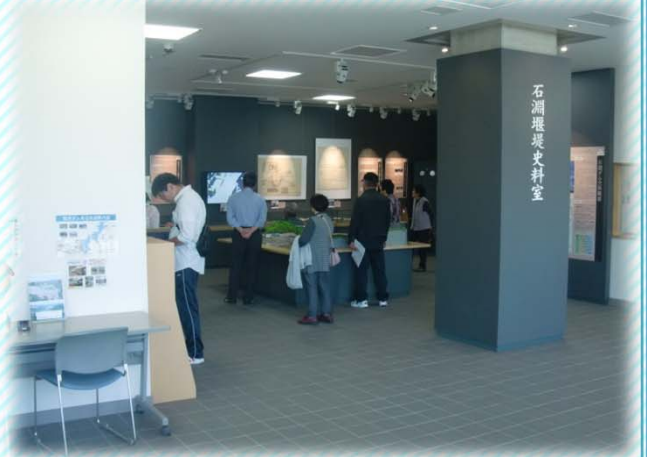
石淵堰堤史料室を見学する様子