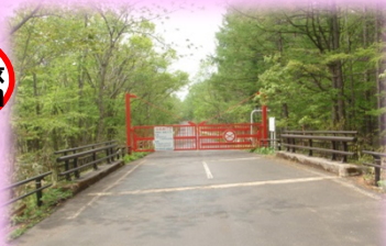
冬季期間中の様子 (現在は開放されています)