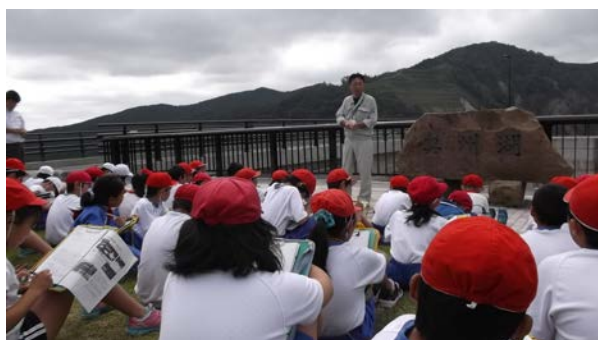
9/1 前沢小学校の皆さん

胆沢ダムには連日たくさんの方が見学者が訪れています。見学者は真剣なまなざしで、ダムの説明に聞き入っていました。今回、その中の一部を紹介します。みなさんも、是非胆沢ダムにお越しください！