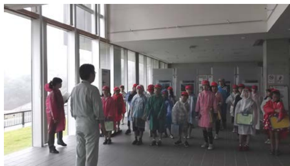
9/5 胆沢第一小学校の皆さん