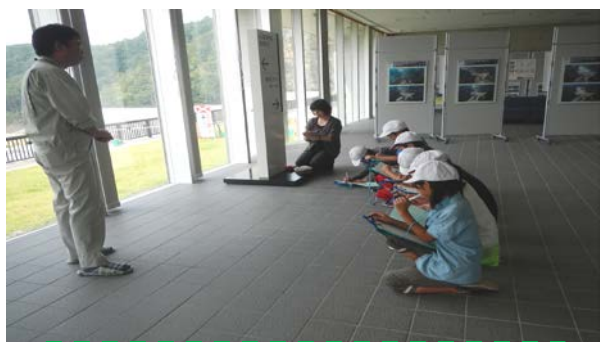
9/8 藤里小学校の皆さん