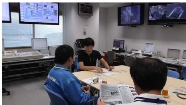
9/4 平泉中学校の職場体験