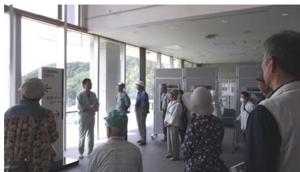
9/3 盛岡市いさりもみじ会の皆さん