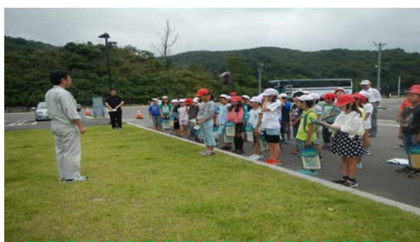
9/10 南都田小学校の皆さん