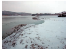
わずかに結氷が確認できます

御所湖では昨年と同様に今年も暖冬傾向にあり、上流に位置する安庭橋付近では部分的な結氷が見られましたが、1月下旬になっても全面結氷は確認されませんでした。