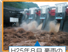
H25年8月 豪雨のダム放流の様子