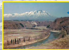
S44年4月 上流側ダムサイト全景(岩手山)

今年は御所湖広域公園が開園して40年です。御所ダム完成からは42年、御所湖の清流を守る会設立からは43年を迎えます。これまでの御所ダムや御所湖周辺の主な出来事をまとめました。