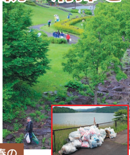
令和5年6月の春の統一清掃の様子

御所湖の清流を守る会では、10月1日(日)午前6時より秋の御所湖周辺統一清掃を実施します。関係機関、各団体には文書にてお知らせいたします。たくさんのご参加をお待ちしております。