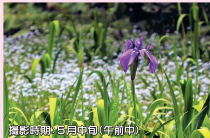
撮影時期: 5月中旬(午前中)

↑尾入野湿生植物園では5月から6月にかけて濃い紫色が印象的なカキツバタが見頃を迎えます。明るい色味のワスレナグサを背景に入れて撮影すると、妖艶な雰囲気のカキツバタが際立ちます。