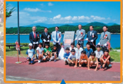
H17年8月 ダム湖百選認定碑の除幕式