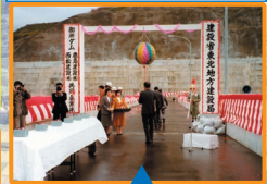
S56年10月御所ダム竣工式