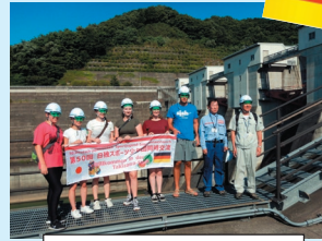
ダムと一緒に記念撮影

8月4日(金)に、国際交流研修の一環でドイツのスポーツ少年団の皆さんが御所ダム見学に訪れました。この日は御所湖広域公園艇庫でカヌー体験も行い、御所湖ができるきっかけとなったダムの概要をドイツ語訳のスライドで説明、その後操作室と監査廊の見学をしました。見学中は多くの質問と「ダムの中に入ることが出来てワクワクした」などの感想がありました。