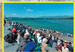
H28年10月 希望郷いわて国体カヌー競技