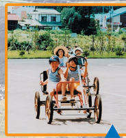
S58年 開園当時の御所湖広域公園