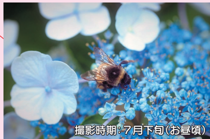
撮影時期: 7月下旬(お昼頃)

↑盛岡手づくり村周辺には青色や赤紫色が印象的なアジサイが植えられています。御所湖周辺では他にも道路沿いや公園内などいろいろな場所で見られます。