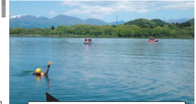
救命索発射装置の発射訓練