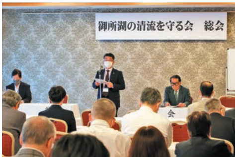
北上川ダム統合管理事務所長よりご祝辞