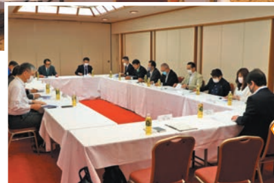
同日午前中には役員会が行われ、議題について確認されました。

御所湖の清流を守る会では、5月18日(木)盛岡つなぎ温泉ホテル紫苑を会場に、第43回定期総会を開催しました。過去3年間はコロナ禍により書面決議としておりましたが、この度4年ぶりに対面開催となり委任状を含む74名が出席されました。