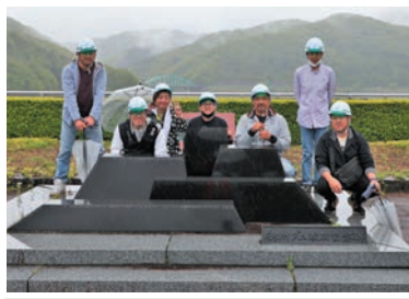
ゲートハウス内の見学 北上川五大ダムの記念碑と記念撮影

5月15日(月)、埼玉県春日部市から春日部市管工事業協同組合青年部のみなさんが御所ダムを訪れました。普段は春日部市の水道事業に従事しているみなさんはダム管理にも関心が高く、熱心に説明を聞いていました。過去にも研修で様々なダムを訪れたことはあるそうですが、監査廊内での見学は初めてとのことでした。