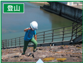
一生懸命登ります！

御所ダムでは7月30日と31日の2日間、初開催となる堤体登山と3年ぶりの実施となる特別見学会が行われました。当日は多くの方にご参加いただき、普段は立ち入ることのできない堤体部分の登山をお仲間と楽しんだり、夏場でも気温が10℃前後に保たれているダムの地下部分（監査廊）の冷たさにおどろいたりしていました。今後も御所ダムとふれあう機会を提供していきたいと考えております。