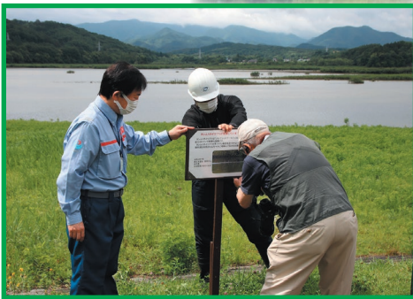
看板は御所湖周辺6箇所に設置しました。

御所湖では貴重な冬鳥である「カムリカイツブリ」の繁殖が7年連続で確認されています。カムリカイツブリは「いわてレッドデータブックDランク」に区分されている貴重な鳥類です。