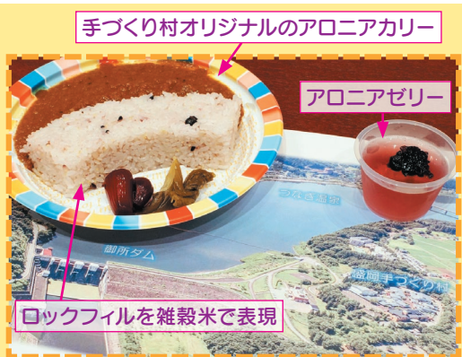
手づくり村オリジナルのアロニアカレー