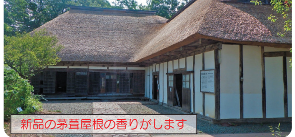
新品の茅葺屋根の香りがします