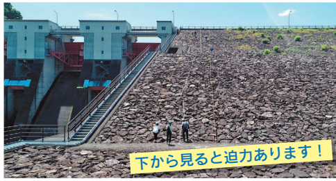
下から見ると迫力あります！

御所ダムでは7月30日と31日の2日間、初開催となる堤体登山と3年ぶりの実施となる特別見学会が行われました。当日は多くの方にご参加いただき、普段は立ち入ることのできない堤体部分の登山をお仲間と楽しんだり、夏場でも気温が10℃前後に保たれているダムの地下部分（監査廊）の冷たさにおどろいたりしていました。今後も御所ダムとふれあう機会を提供していきたいと考えております。