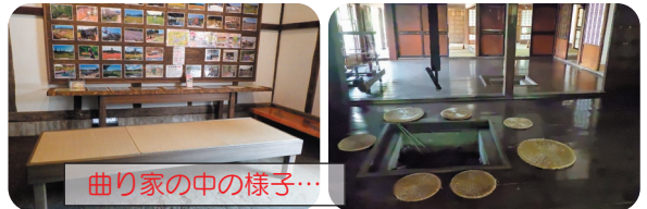
曲り家の中の様子…

茅葺屋根の葺き替え工事を行っていたさくら園の南部曲り家では工事が完了し、一般の方の公開を再開しています。見学は無料で、自由にご覧いただけます。茅葺屋根の屋内は天然のクーラーと言われており驚くほど涼しいので、ぜひお立ち寄りください。