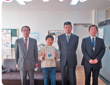
雫石町立御明神小学校

12月10日(金)～17日(金)にかけ「御所湖の清流を守るポスター」の入賞者表彰式を盛岡市繫地区と雫石町内の各小学校にて行いました。入選者には自分の描いた絵入りの賞状を贈り、応募者全員に参加記念品と作品集を贈りました。