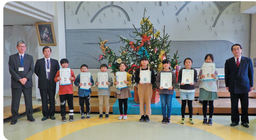
雫石町立七ツ森小学校