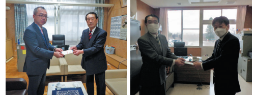
雫石町立雫石中学校 雫石町立御所小学校