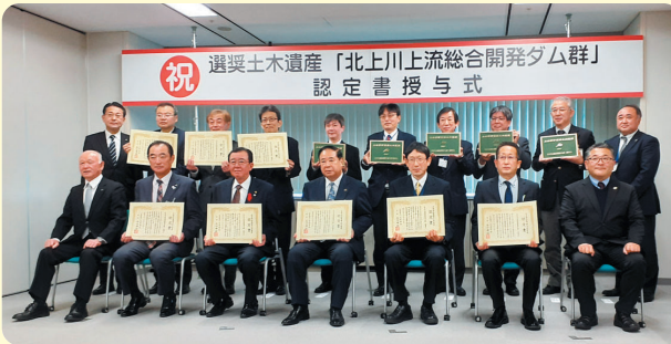
11月26日 選奨土木遺産認定書授与式

土木学会選奨土木遺産に認定された「北上川上流総合開発ダム群」の認定書授与式が11月26日(金)に行われました。