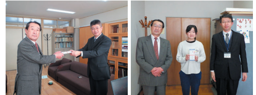
雫石町立御明神小学校 雫石町立西山小学校