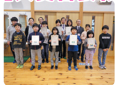
盛岡市立繫小学校