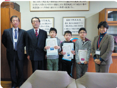
雫石町立雫石小学校