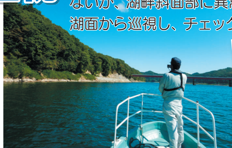
湖畔斜面部異常なし。変な漂流物もなし。