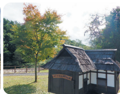
矢櫃地区水辺園地