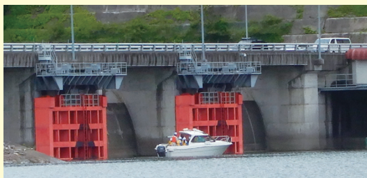
船に乗り、放流ゲートを貯水池側から間近で見学