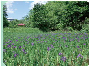
尾入野湿性植物園のカキツバタ

5月中旬、町場地区園地では菜の花が満開。来場者は可愛らしい菜の花に囲まれ、散歩や撮影を楽しんでいました。