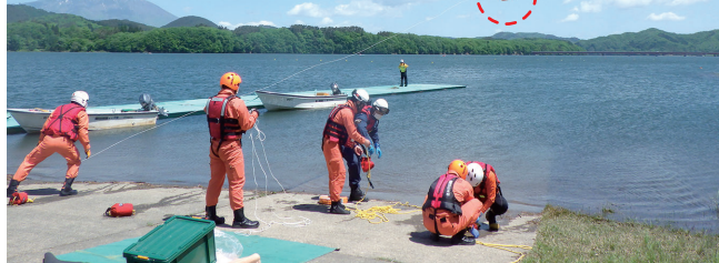
スローバッグを要救助者に向けて投げ込み、それを繰り返し練習

訓練では、要救助者へのスローバッグ（浮き）投てき訓練や、救命ボートの操縦訓練、落水した要救助者の救命訓練等行われました。