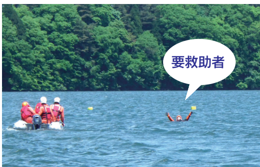
落水した要救助者の救命訓練