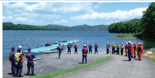
水難事故救命訓練、お疲れ様でした！