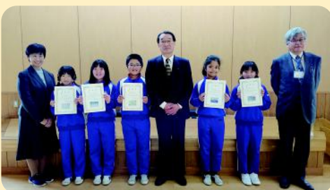
雫石町立御所小学校