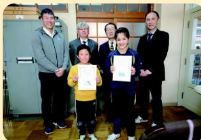
雫石町立御明神小学校