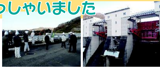
天端では御所発電所 間近に見える放流ゲート