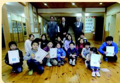
盛岡市立つなぎ小学校