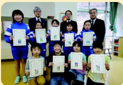
雫石町立七ツ森小学校