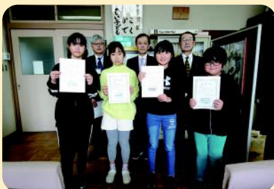
雫石町立雫石小学校