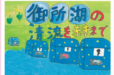
▲平成29年度最優秀作品

【お問合せ】御所湖の清流を守る会事務局(御所ダム)TEL/019-689-2216