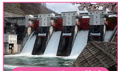
クレストゲート放流