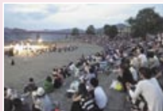
階段護岸にはたくさんの人が集まりました