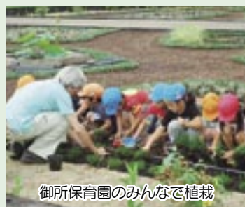
御所保育園のみんなで植栽