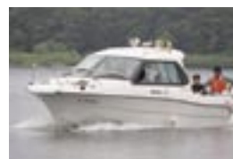
船に乗って湖面巡視体験を実施

御所湖まつり同日、県漕艇場で行われた湖上フェスティバルでは、カヌーやボート、湖面の巡視など様々な体験が行われ、湖に親んでもらいました。