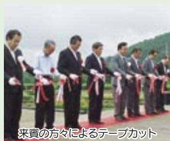
来賓の方々によるテープカット

この公園は、御所湖広域公園でも20地区目となる公園で、基本構想段階から町場地区のみなさまを始めとする多くの方々と一緒に計画そして整備してきた公園です。