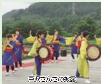
戸沢さんさの披露