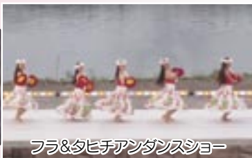
フラ&タヒチアンダンスショー