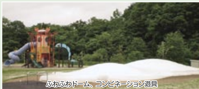
ふわふわドーム、コンビネーション遊具

開園式では、雫石町長、岩手県議会議員より祝辞のあいさつをいただき、指定管理者KOIWAIから園地の見所を紹介した後、地元の「戸沢さんさ」の披露、御所保育園児のみなさんによるエリカの植栽を行い閉会しました。その後、同公園内の炊事棟の使い始めとして、バーベキューの振る舞いと地元雫石町の名物“軽トラ市”で町場地区園地の開園を祝いました。