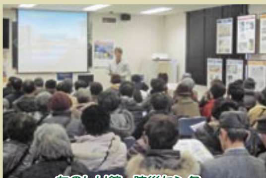
ものしり館・防災センター