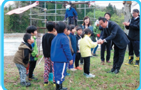
教育長からの記念品の贈呈大きな声で御礼を言っていました