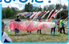
鯉のぼりをたくさん運んで掲揚のお手伝いをしました