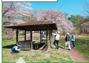
設備に破損等の異常がないか確認します