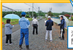
滝沢市の担当者や地域の方と聞こえ方の確認します