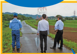
令和5年度ダム警報訓練の様子