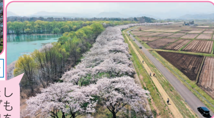
4月18日ドローンによる空撮写真