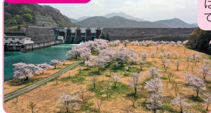
4月18日ドローンによる空撮写真