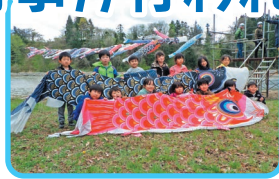
御所小学校1年生のみなさん。鯉のぼりをたくさん運んで記念撮影

この掲揚事業は、子どもたちの健やかな成長を願い5月5日の子どもの日に合わせて実施されており、今年度で30回目となります。子供たちが一生懸命に運んだ鯉のぼりは、春の風に乗って雫石川上空を元気に泳いでいました。