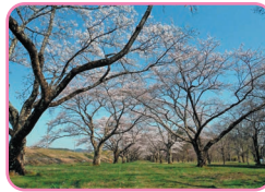
4月15日桜のトンネル