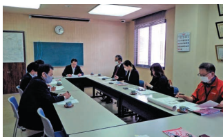
←令和6年 4月18日の幹事会の様子