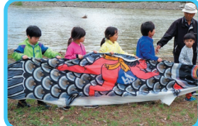
「赤!」「青!」「金!」と、色とりどりの鯉のぼりに大喜びのみなさん