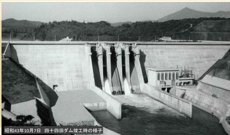
昭和43年10月7日 四十四田ダム竣工時の様子

昭和43年(1968年)10月7日、四十四田ダムの竣工式が行われました。四十四田ダムは今年で56才です。これまで地域の皆様にはご理解とご協力を賜り感謝申し上げます。これからも地域の安全・安心を守るため、ダムの効果を十分発揮できるよう適切なダム管理・運営を行ってまいります。