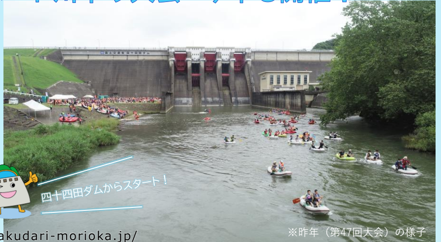
※昨年(第47回大会)の様子

7月28日(日)に第48回盛岡・北上川ゴムボート川下り大会が開催されます。スタート地点の四十四田ダムは、毎回多くの参加者や色とりどりのボートで賑わいます。参加募集はすでに始まっていて7月5日までです。盛岡の街並みを北上川から眺める絶好の機会です。ぜひご参加ください。