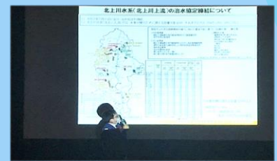
講演に先立ち当事務所からは北上川5大ダムの最近のトピックスを紹介しました

なお、本セミナーは、新型コロナウイルス感染予防対策を行い、参加者の人数も制限し開催しました。