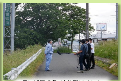
テレビ局の取材を受けました