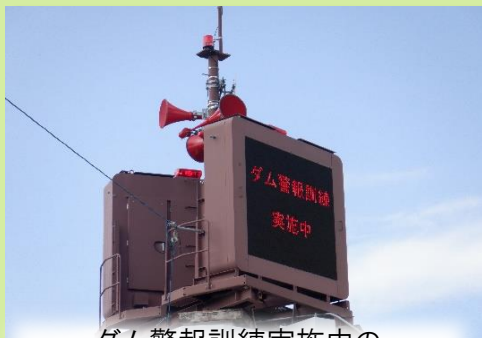
ダム警報訓練実施中の 大型電光掲示板

※異常洪水時防災操作とは、計画を越える洪水によりダムに貯められなくなり、ダムに流れ込んできた水をそのまま下流に流すことです。ダムに流れ込む水量以上を流すことはありません。