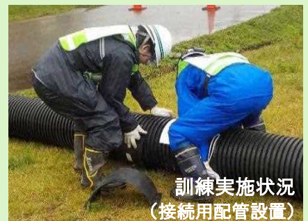
訓練実施状況 (接続用配管設置)

災害や事故が発生した場合の迅速かつ的確な対応を図るため、中和処理施設では「旧松尾鉱山新中和処理施設に係る災害・事故等対応マニュアル」を作成しています。また、災害時の対応及び連絡体制を点検・整備することを目的に、毎年、関係機関が連携して、地震などによる災害を想定した訓練を実施し、災害時の対応に万全を期しています。