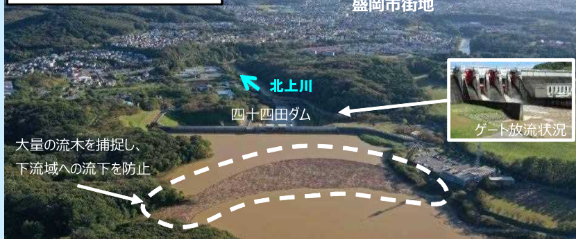
大量の流木を捕捉し、下流域への流下を防止

総雨量：125.6mm 最大流入量：671m 3 /s 放流量：112m 3 /s 貯めた水量：1,807万m 3 (東京ドーム14.6個分)