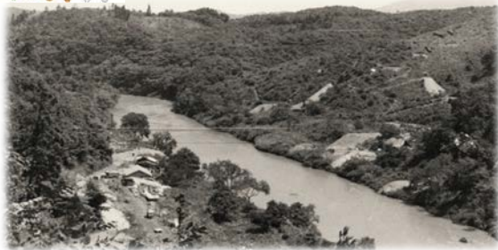
建設前の四十四田ダムサイト