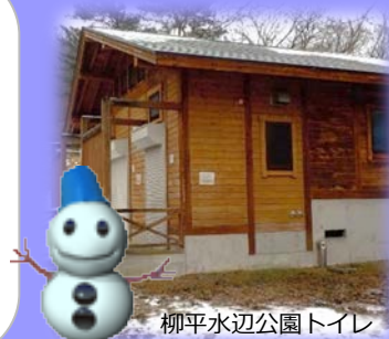
柳平水辺公園トイレ

柳平水辺公園のトイレを冬期閉鎖しました。3月下旬頃まで使用できません。ご不便をおかけしますがご理解のほどよろしくお願いいたします。