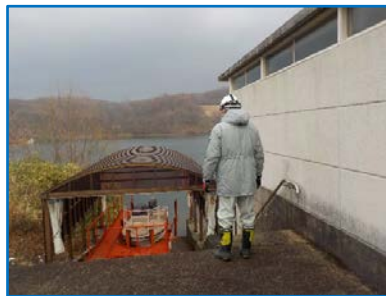
船庫や巡視船の確認