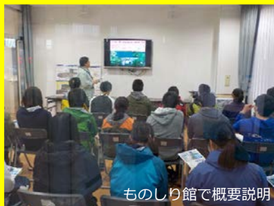
ものしり館で概要説明