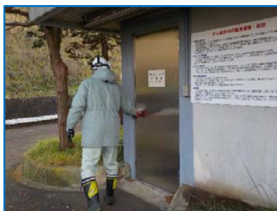
左岸監査廊の入り口の確認