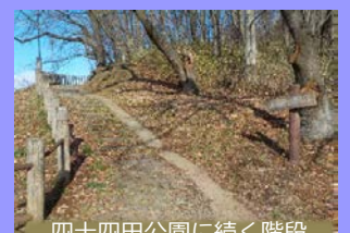
四十四田公園に続く階段