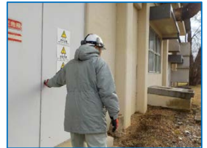
周辺の異常や施錠などの確認