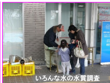
いろいろな水の水質調査