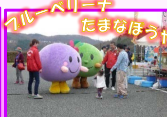
岩手町キャラクター

特産のキャベツの「たまなぼうや」とブルーベリーの「ブルーベリーナ」は岩手町PRキャラクター