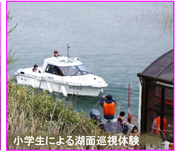
小学生による湖面巡視体験

湖畔ステージショー 昨年、ダム建設功労者表彰を受賞した「川又神楽」と「川前神楽」による演舞のほか、盛岡市を中心に活動しているキッズダンスやよさこいなどで会場は大いに盛り上がり、観客からは大きな拍手が送られました。