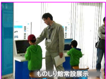
ものしり館常設展示