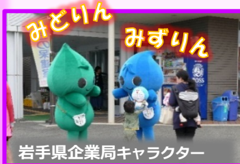
岩手県企業局キャラクター

毎年さくらまつりに岩手県企業局と水源地域からキャラクターたちが遊びに来てくれます。すぐに子どもたちに囲まれちゃう大人気のキャラクターたちは、じゃんけん大会などで会場の皆さんと交流を深めました。 ※人だかりで見えない一部のキャラクターにはアップの写真もつけてみました(^_^)