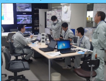
雨量・水位などの情報を収集し操作等の判断を行なう訓練

これから雨や台風が多くなる時期ですが、実際に洪水が来た時は今回の訓練をいかして対応していきと思います。