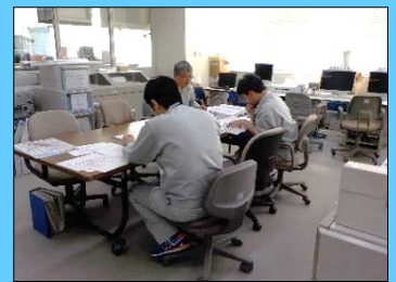
計算用コンピュータが使用できない場合を想定したダム操作訓練