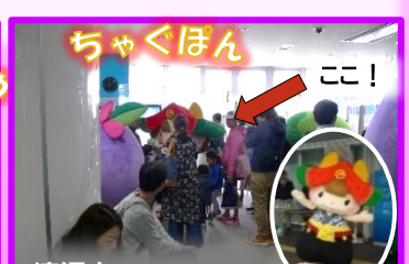
滝沢市キャラクター

特産のキャベツの「たまなぼうや」とブルーベリーの「ブルーベリーナ」は岩手町PRキャラクター