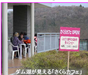
ダム湖が見える「さくらカフェ」

地元みんなの商店街・流域うまいもん市&フリーマーケット いわて八幡平の大湧水で淹れたコーヒーを提供する「さくらカフェ」や「地元みんなの商店街・流域うまいもん市」「フリーマーケット」など、多くの人で賑わいました。