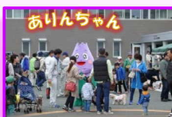
八幡平市キャラクター

水力発電・工業用水をイメージした水の妖精「みずりん」と風力発電・太陽光発電をイメージした緑の妖精「みどりん」