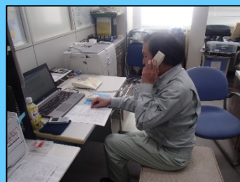
関係する警察・消防・県・市町村・報道機関へ通知する訓練