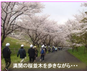
満開の桜並木を歩きながら・・・

四十四田ダム&発電所見学と小学生による湖面巡視体験 毎年人気の監査廊・発電所&小学生による湖面巡視体験には今年も多くの希望者があり、普段公開していないダム内部の見学や、ボートでのダム湖巡視などを体験していただきました。