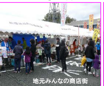
地元みんなの商店街