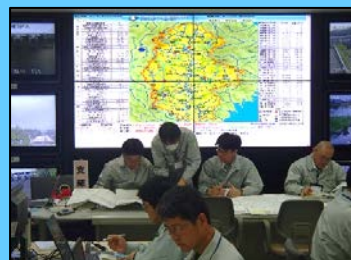
各ダムの状況を報告し、ダム操作方針等を調整する訓練