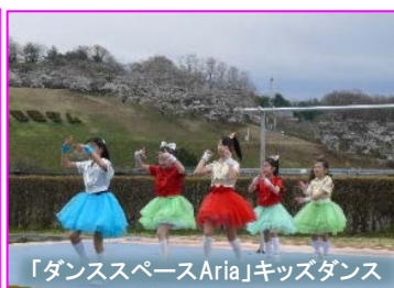
「ダンススペースAria」キッズダンス