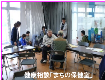
健康相談「まちの保健室」

南部片富士湖ものしり館イベント パネル展示や常設展示のほか、「いろいろな水の水質調査」では県内5ヶ所の水をリトマス紙を使って調べたり、「まちの保健室」では血圧測定や健康診断が行なわれ、多くの人々がものしり館に訪れました。