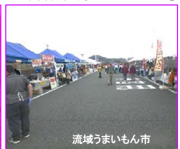
流域うまいもん市