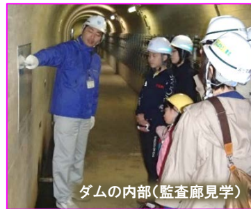
ダムの内部(監査廊見学)