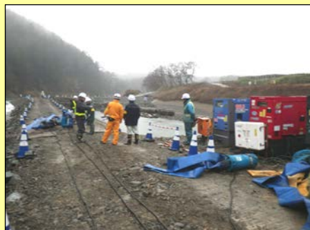
パトロールの様子

参加者はこの安全パトロールを機会として、それぞれの担当している工事の安全性を再確認しました。