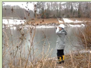
四十四田ダムでも監視を強化しています

感染した鳥のフンなどを踏んだ靴から、被害を拡散してしまう恐れもあります。被害を最小限に留めておくためにもご協力をお願いいたします。