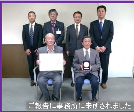
ご報告に事務所に来所されました