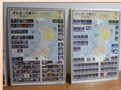
東北地方のダムカード一覧

ものしり館セミナールーム前にて、パネルを展示しています。ダムの効果や役割等、写真でわかりやすく説明しています。東北地方のダムカード一覧など見たら思わず集めたいくなるような内容です。ぜひ一度ご覧下さい。