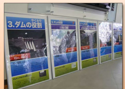
ダムの役割について説明