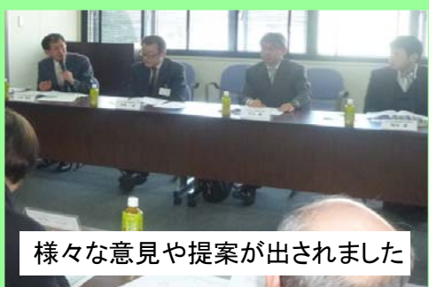
様々な意見や提案が出されました

また、平成26年度の活動計画では、昨年度の事業を改善しながら継続するほか、全体の情報共有を促すことを目的とした「川前地区の歴史探索」や「丹藤川の砂金調査に係わる活動」などの情報収集活動が提案されました。