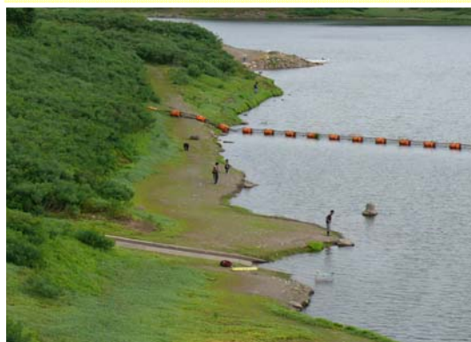
↑釣りを楽しんでいる方々

四十四田ダムでは多数の方が釣りを楽しんでいただいております。しかし残念な事に、釣りのルアーが草に引っかかり、そのまま放置されていたりするのも見受けられます。ルアーの先には釣り針がついており、他の利用者がケガをしたりすると大変危険です。みなさまが安全に楽しんでいただくためにも、引っかかったルアーの放置などをせずマナーを守って釣りを行ってください。