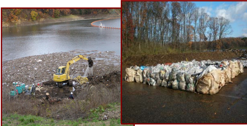
↑ 流木及びゴミの引き上げ並びにゴミの集積状況