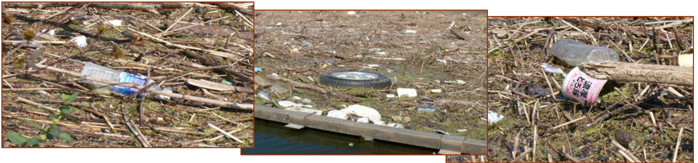
↑ 流れ着いたペットボトル、タイヤ、カップ麺等