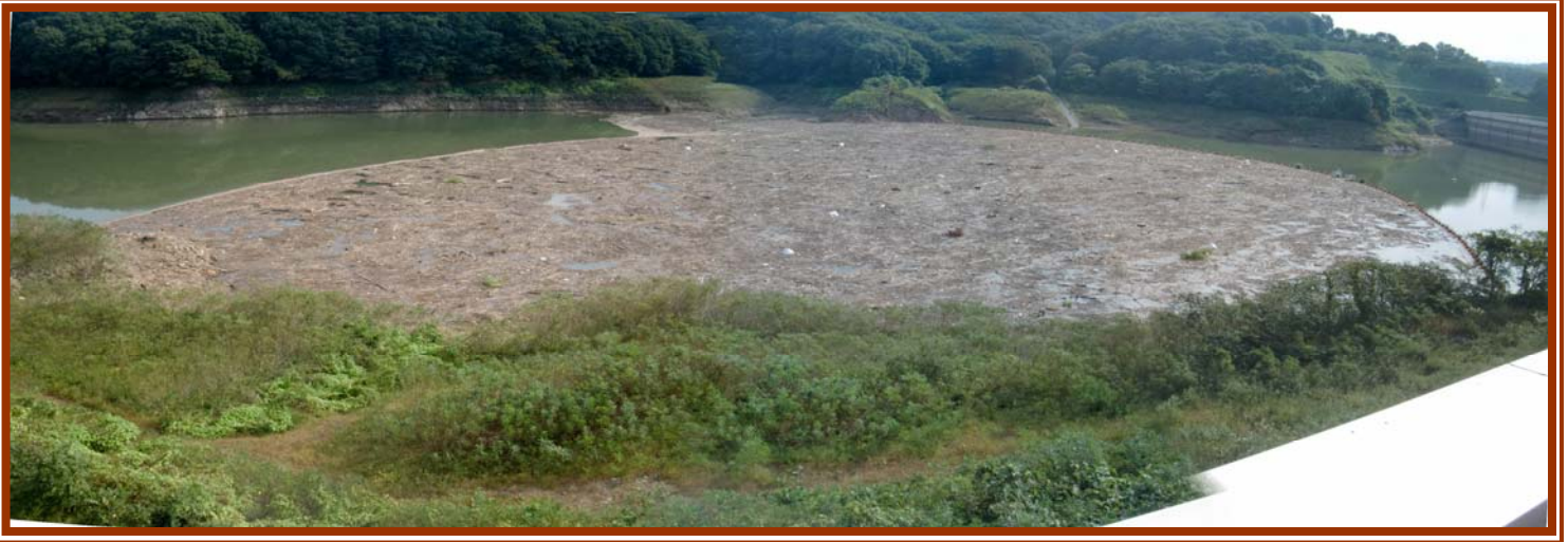
↑ 平成23年9月21日の出水により流れ着いた流木及びゴミ

四十四田ダムの上流及び貯水池周辺に、ゴミを捨てると最終的にはすべて四十四田ダムに流れてきます。ゴミを捨てたりしないよう、みなさまの御協力をお願いします。