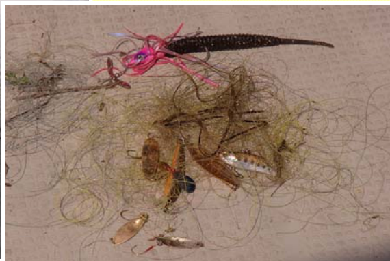
↑釣りルアーの放置及び回収状況