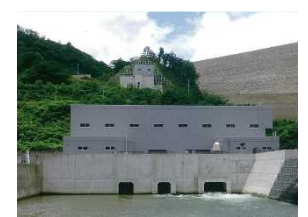
発電所（胆沢第一・第三）