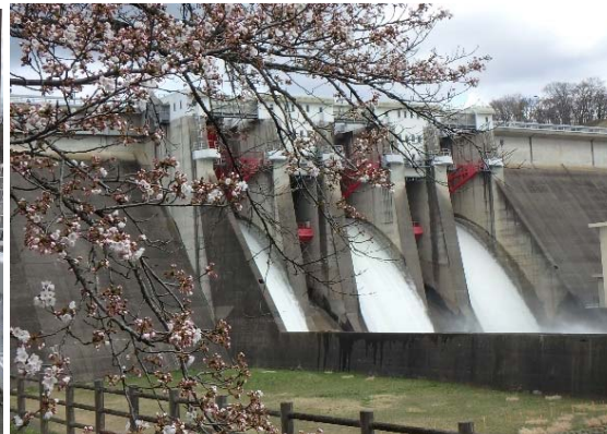
クレストゲートからの放流と桜