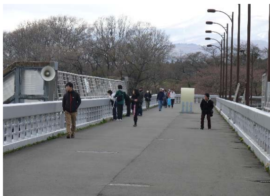
ダム天端からの放流見学者