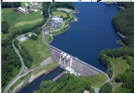
四十四田ダム(S43年完成)