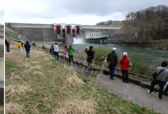
ダム直下流でカメラを構える見学者