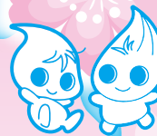
岩手県企業局キャラクター 「みずりん・みどりん」

※当日は、係員の指示に従って ご駐車下さい。 ※駐車場には限りがございます ので、お近くの方は可能な限 り別的手段でご来場下さい。