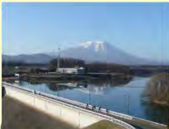
물위에 거꾸로 비친 남부후지