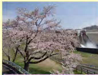
댐 독몸 벚꽃이와 해설방류