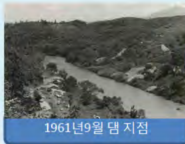
1961년 9월 댐 지점

시즈시다댐이 건설될 당시의 사진과 완공된 때 사진입니다. 지역의 분들 협조를 받아서 여기에 시즈시다댐이 건설되었습니다.