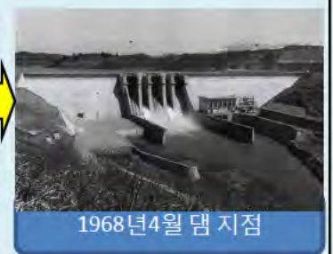
1968년 4월 댐 지점